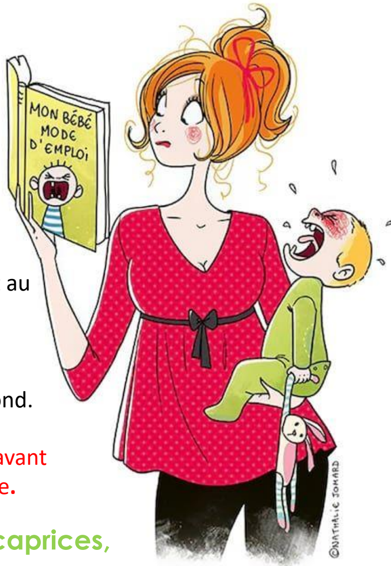
Illustration Nathalie Jomard

Les pleurs de bébé ne sont pas des caprices, ni de la comédie.